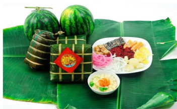
ベトナムの旧正月料理